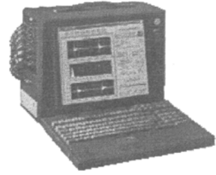
(a)PAC Mistras 2001 声发射仪 (b) 德国 Vallen AMSY5 声发射仪(c) 广州声华 WAE2002 声发射仪